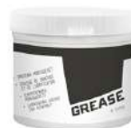
Grasa de montaje