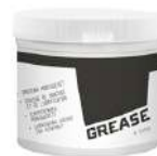
Grasso di montaggio