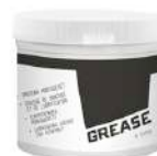
Grasa de montaje