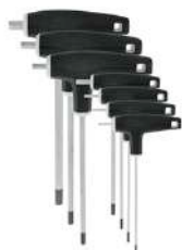
Llaves Allen (de 5 à 8mm)