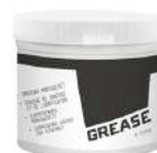
Graisse de montage